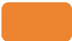
CTD 651 Navel