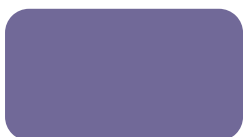
CTD 655 Forget Me Not