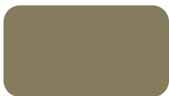
CTD 751 Avogado