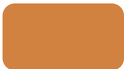
CTD 755 Amber Wave